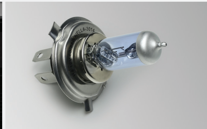
Bulbos de halógeno