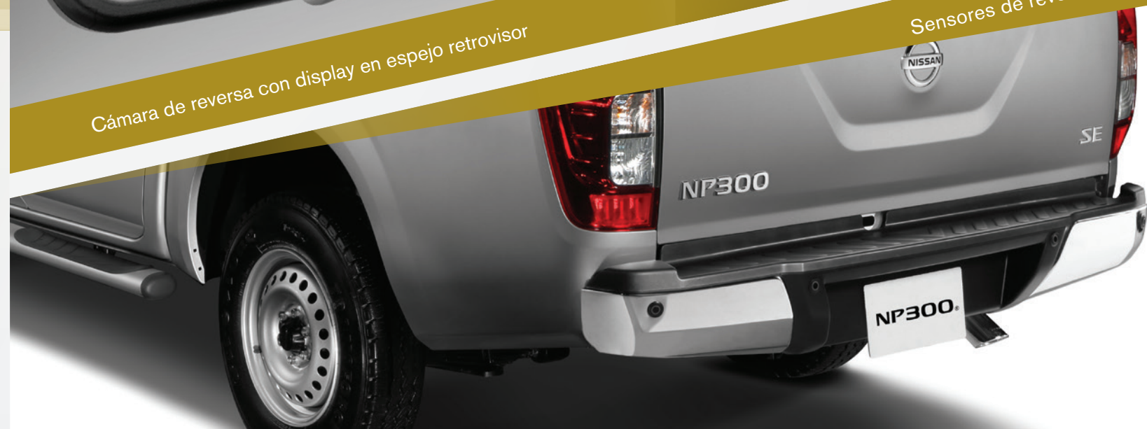
Sensores de reversa