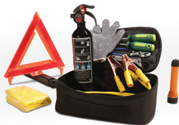
Kit de emergencia