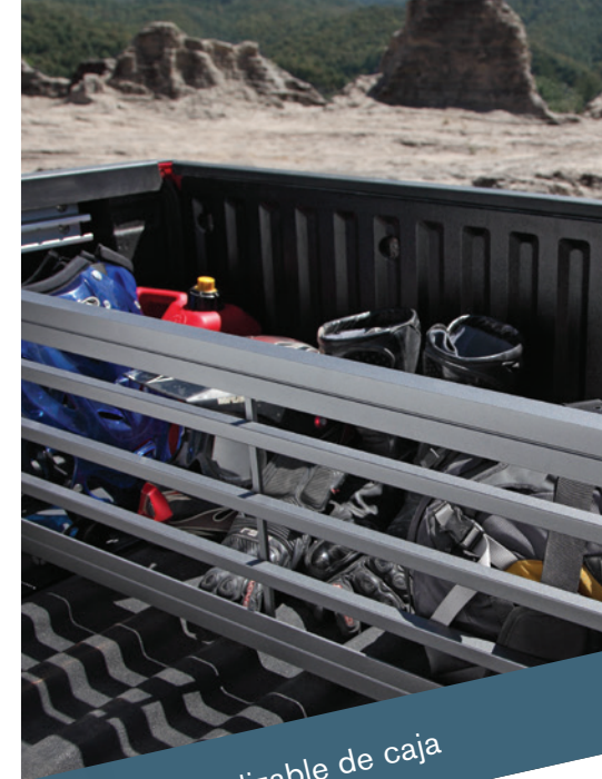
Separador deslizable de caja