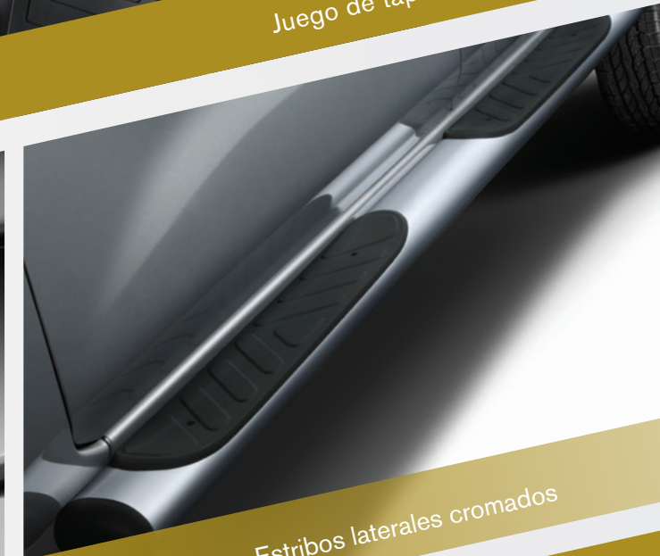
Estribos laterales cromados