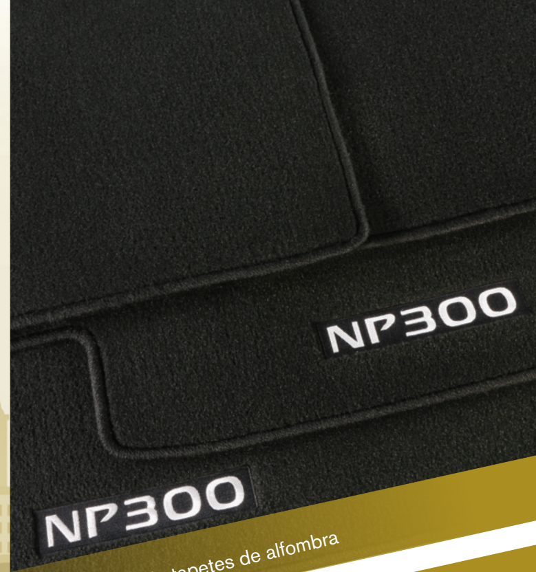
Juego de tapetes de alfombra