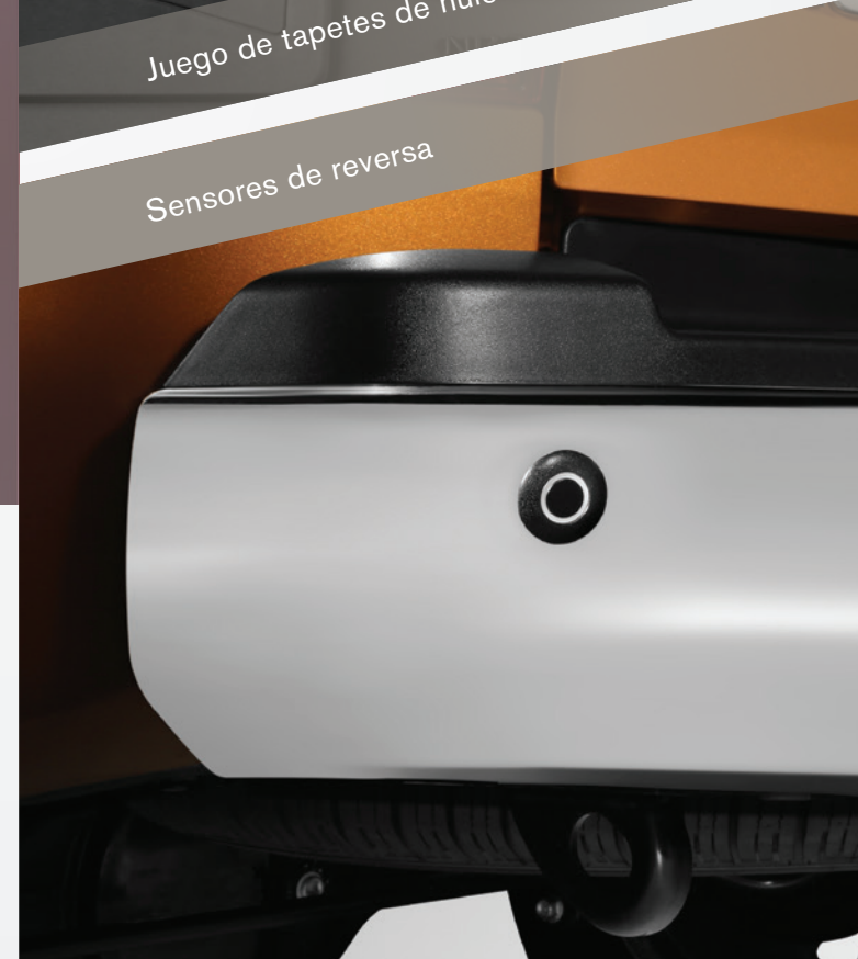
Sensores de reversa