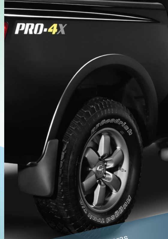
Set de loderas traseras