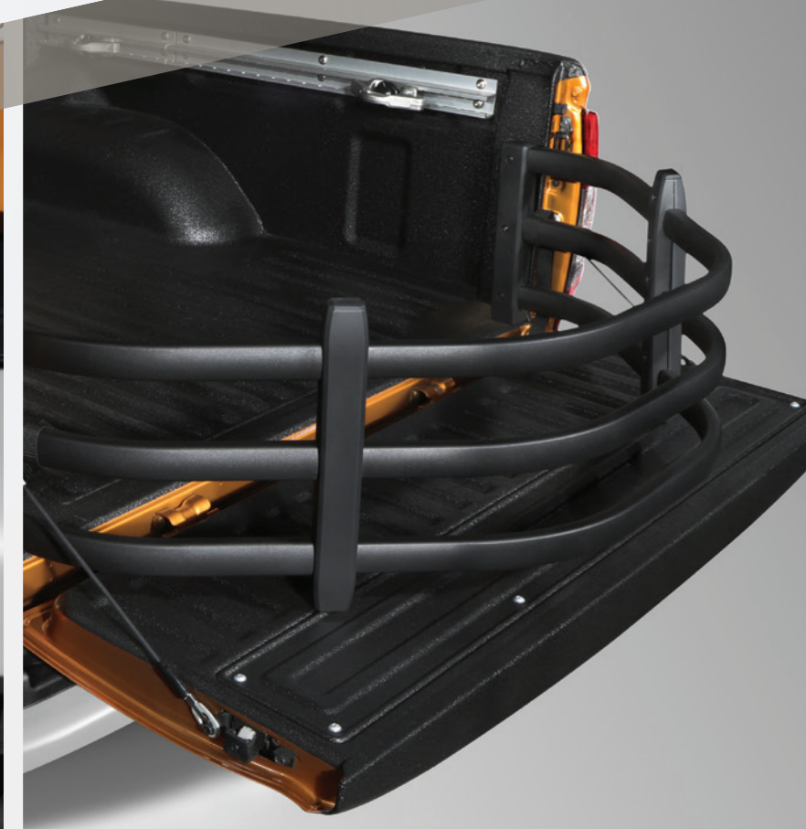
Extensión de área de carga