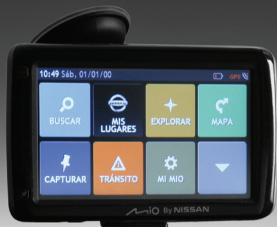
Sistema de Navegación Mio