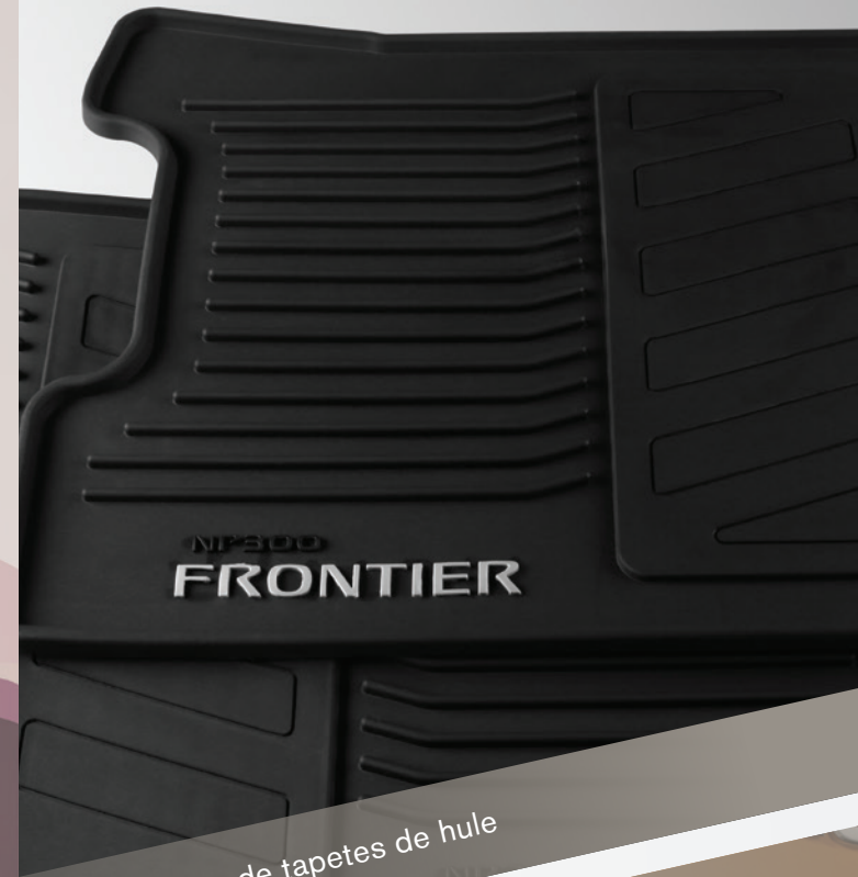
Juego de tapetes de hule