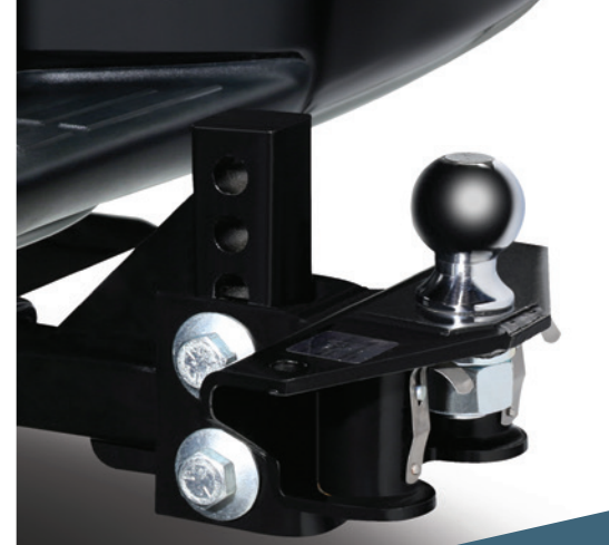
Kit de remolque clase 4 (incluye bola de remolque)