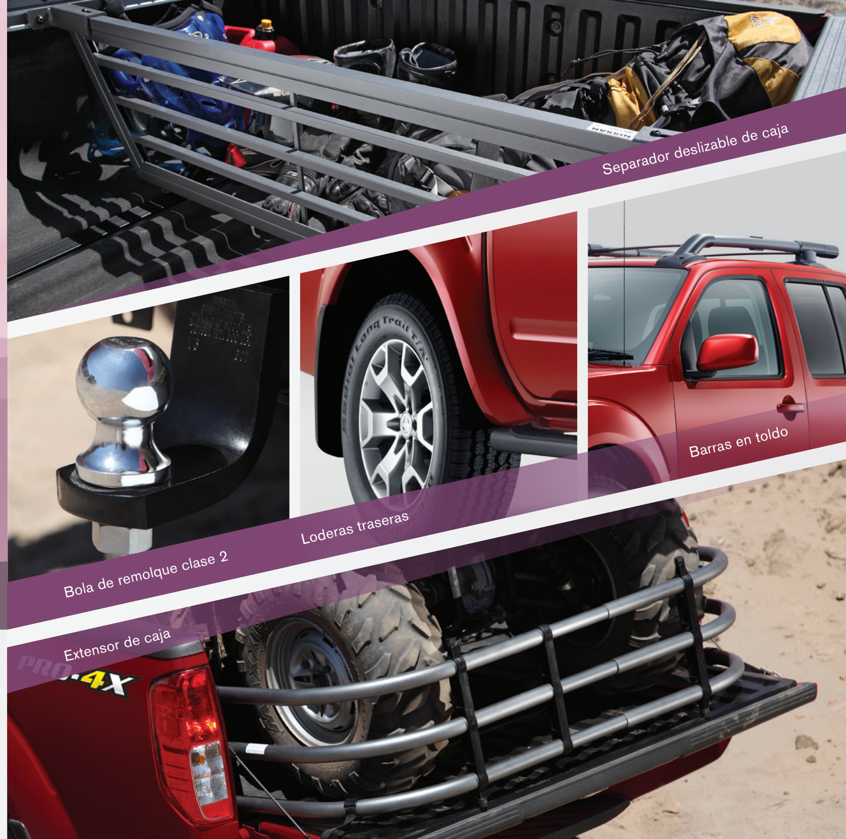
Separador deslizable de caja