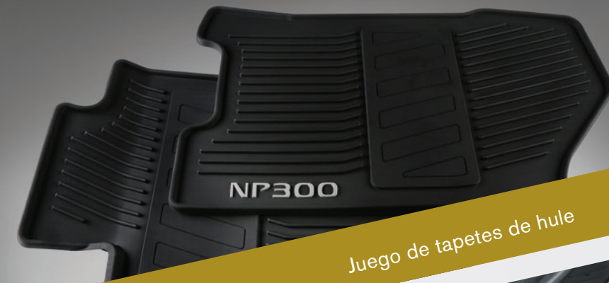
Juego de tapetes de hule