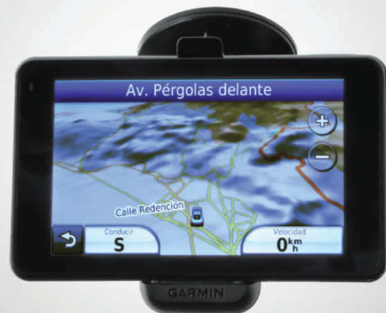
Sistema de Navegación Garmin