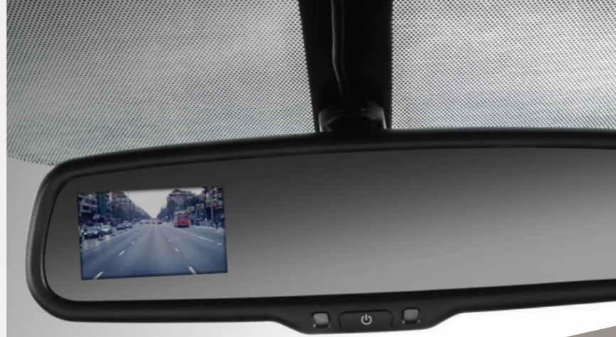
Cámara de reversa con display en espejo retrovisor