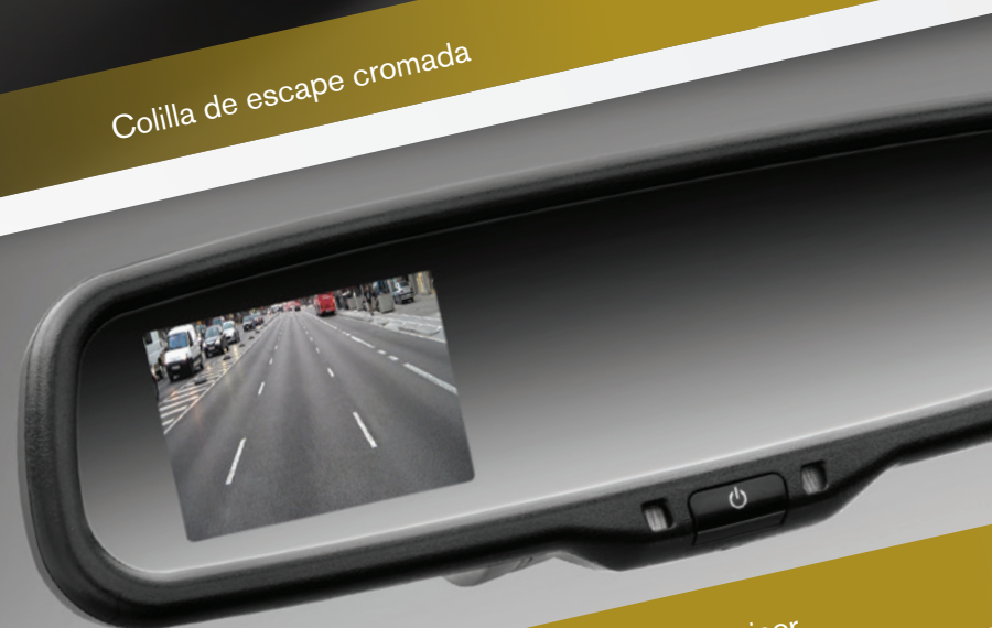
Cámara de reversa con display en espejo retrovisor