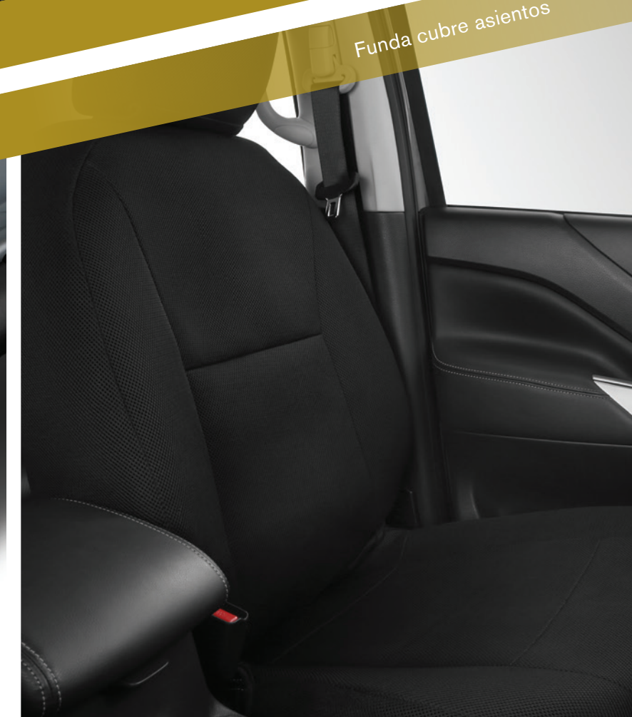
Funda cubre asientos