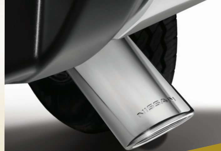
Colilla de escape cromada