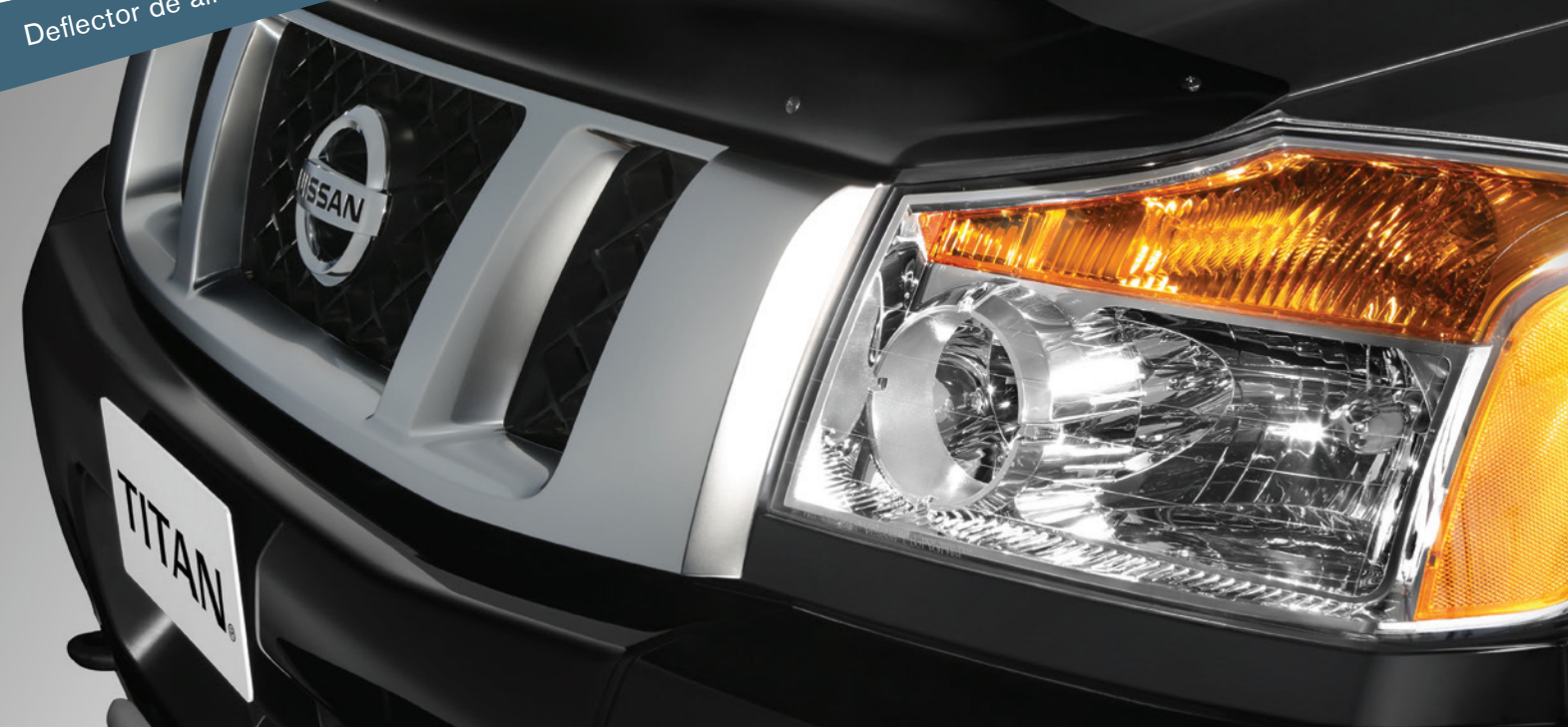
Deflector de aire en cofre