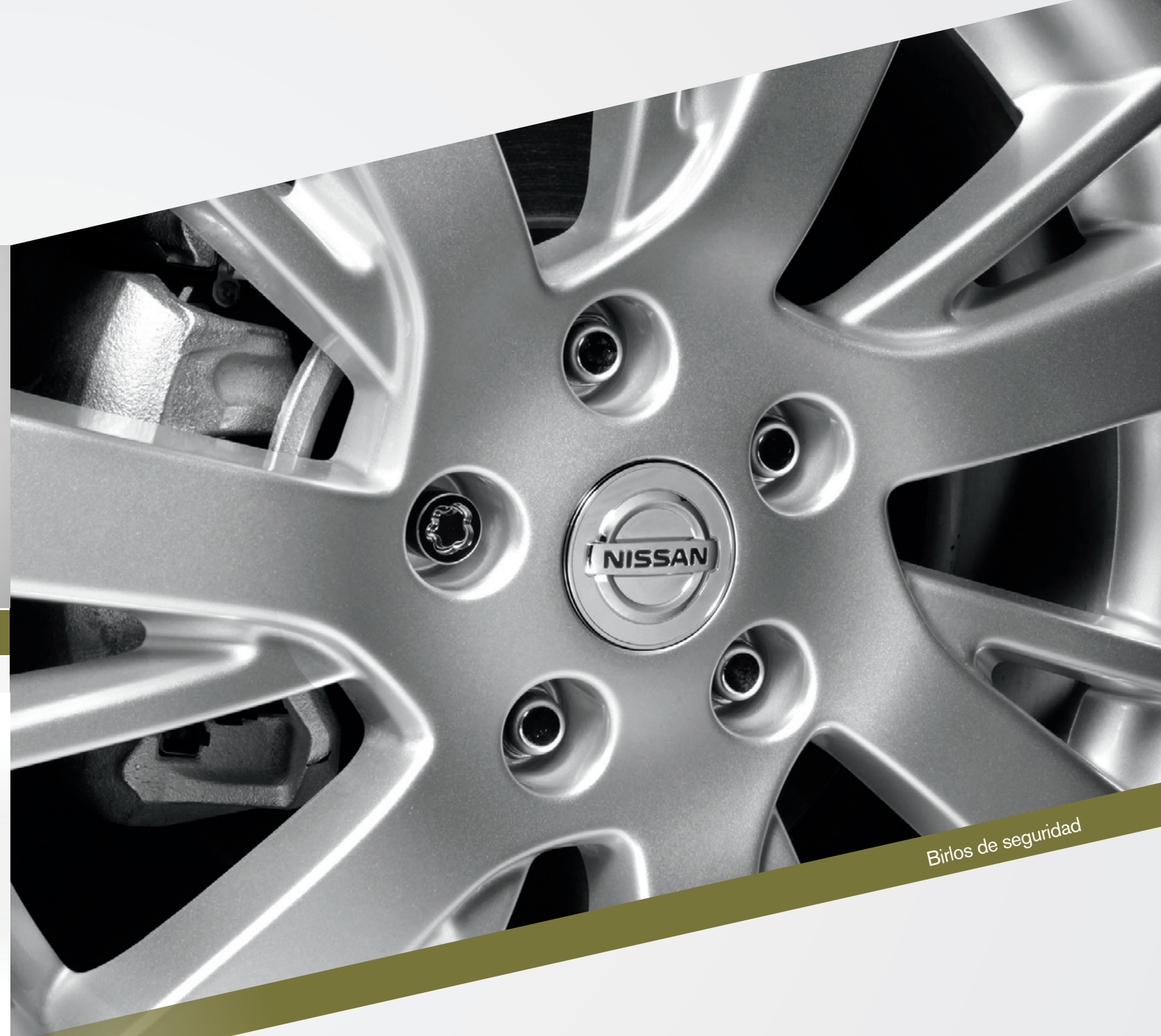
Birlos de seguridad